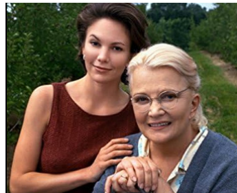
1998 GRACE ET GLORIE (Grace & Gloria) d'Arthur Allan Seidelman avec Diane Lane