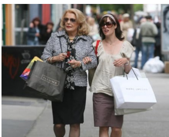
2007 BROKEN ENGLISH de Zoe Cassavetes avec Parker Posey