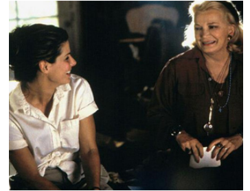
1998 AINSI VA LA VIE (Hope Floats) de Forest Whitaker avec Sandra Bullock