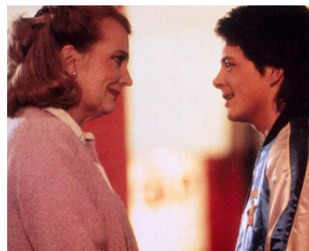
1987 ELECTRIC BLUE (Light of Day) de Paul Schrader avec Michael J. Fox