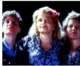
1995 LA BIBLE DE NÉON (The Neon Bible) de Terence Davis avec Diana Scarwid, J. Tierney