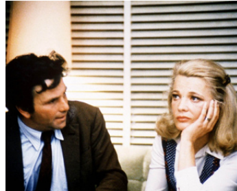
1974 UNE FEMME SOUS INFLUENCE (A Woman under the Influence) de J. Cassavetes avec P. Falk