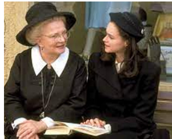
2002 CHARMS FOR THE EASY LIFE de Joan Micklin Silver avec Mimi Rogers