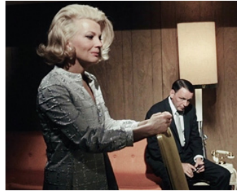
1967 TONY ROME EST DANGEREUX (Tony Rome) de Gordon Douglas avec Frank Sinatra