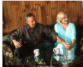
2002 HYSTERICAL BLINDNESS de Mira Nair avec Ben Gazzara