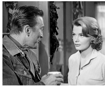
1962 SEULS SONT LES INDOMPTÉS (Lonely are the Brave) de David Miller avec Kirk Douglas