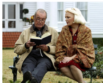
2004 N'OUBLIE JAMAIS (The Notebook) de Nick Cassavetes avec James Garner