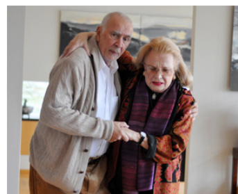
2013 PARTS PER BILLION de Brian Horiuchi avec Frank Langella