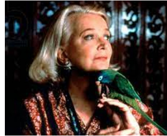
1998 PAULIE, LE PERROQUE QUI PARLAIT TROP (Paulie) de John Roberts