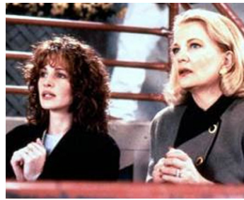
1995 AMOUR ET MENSONGES (Something to talk about) de Lasse Hallström avec Julia Roberts