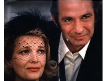
1977 OPENING NIGHT (Opening Night) de John Cassavetes avec Ben Gazzara