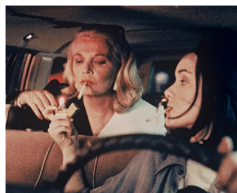
1991 UNE NUIT SUR LA TERRE (Night on Earth) de Jim Jarmush avec Béatrice Dalle