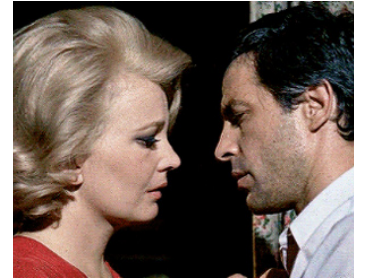
1968 LES INTOUCHABLES (Gli Intoccabili) de Giuliano Montaldo avec John Cassavetes