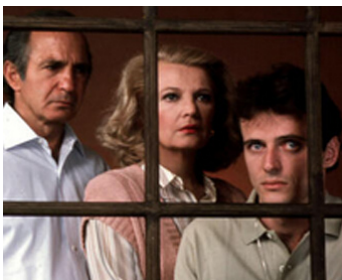
1985 UN PRINTEMPS DE GLACE (An early Frost) de John Erman avec Ben Gazzara, Aidan Quinn