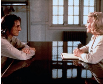
1997 SHE'S SO LOVELY (She's so lovely) de Nick Cassavetes avec Sean Penn