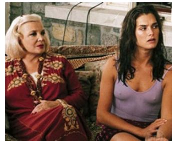
1999 LE WEEK-END (The Week-end) de Brian Skeet avec Brooke Shields