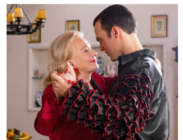
2014 SIX DANCE LESSONS IN SIX WEEKS d'Arthur Allan Seidelman avec Cheyenne Jackson