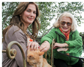
2011 OLIVE (Olive) de Patrik Gilles et Hooman Khalili