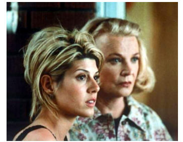
1996 DÉCROCHE LES ÉTOILES (Unhook the Stars) de Nick Cassavetes avec Marisa Tomei