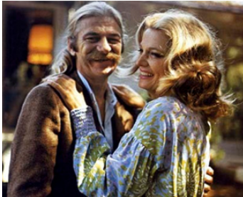
1971 AINSI VA L'AMOUR (Minnie and Moskowitz) de John Cassavetes avec Seymour Cassel