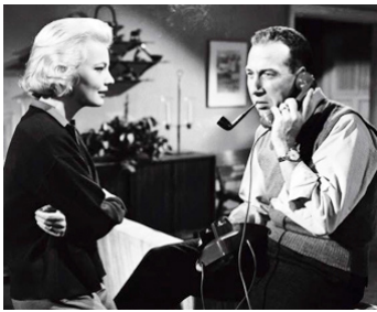
1958 L'AMOUR COÛTE CHER (High cost of Loving) de et avec José Ferrer