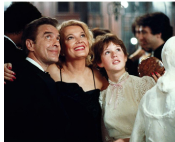
1982 TEMPÊTE (Tempest) de Paul Mazursky avec John Cassavetes, Molly Ringwald