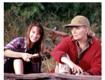
1992 CRAZY IN LOVE (Crazy in Love) de Martha Coolidge avec Holly Hunter