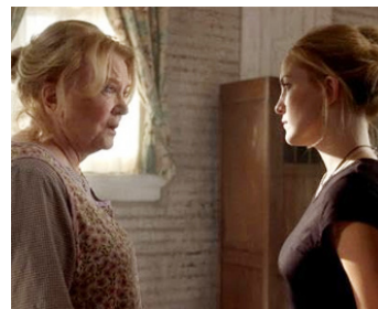
2005 LA PORTE DES SECRETS (The Skeleton Key) d'Iain Softley avec Kate Hudson