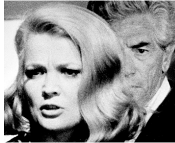
1968 FACES (Faces) de John Cassavetes avec John Marley