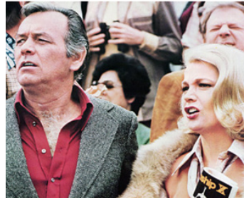
1976 UN TUEUR DANS LA FOULE (Two-minute Warning) de Larry Peerce avec David Janssen