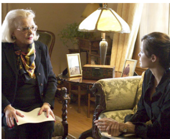
2004 DESTINS VOLÉS (Taking Lives) de D. J. Caruso avec Angelina Jolie