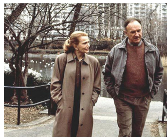
1988 UNE AUTRE FEMME (Another Woman) de Woody Allen avec Gene Hackman