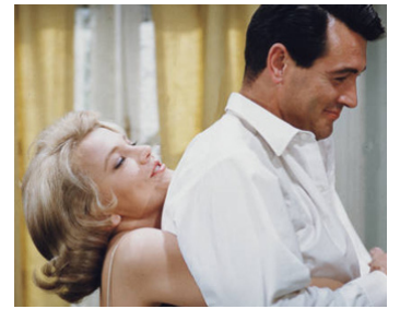
1962 L'HOMME DE BORNÉO (The Spiral Road) de Robert Mulligan avec Rock Hudson