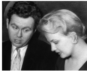
1959 SHADOWS (Shadows) de John Cassavetes avec Jean Shepherd (apparition)