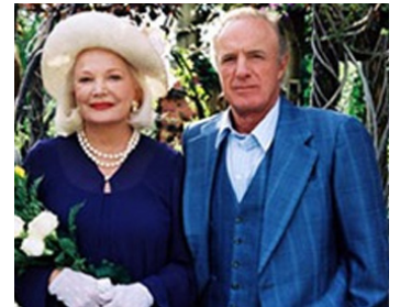
2003 L'INCROYABLE MME RITCHIE (The incredible Mrs Ritchie) de P. Johansson avec James Caan