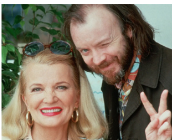
1991 TED ET VÉNUS (Ted and Venus) de Bud Cort avec Bud Cort