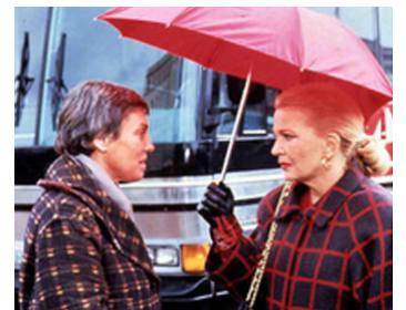
1991 LE VISAGE DE L'ÉTRANGER (Face of a Stranger) de Claudia Weill avec Tyne Daly