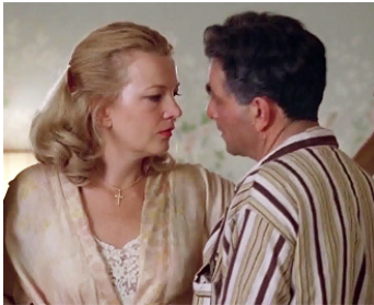
1978 TÊTES VIDES CHERCHENT COFFRES PLEINS (The Brink's Job) de W. Friedkin avec Peter Falk