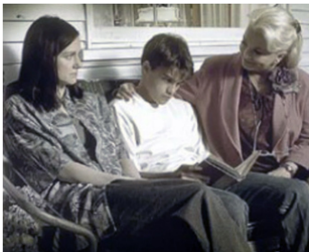
2001 L'IRIS SAUVAGE (Wild Iris) de Daniel Petrie avec Laura Linney, Emile Hirsch