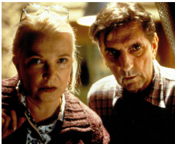
1998 LES PUISSANTS (The Mighty) de Peter Chelsom avec Harry Dean Stanton