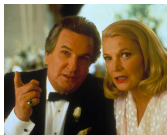
1991 CE CHER INTRUS (Once around) de Lasse Hallström avec Danny Aiello