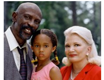
2000 LA COULEUR DE L'AMOUR (The Color of Love) de Sheldon Larry avec Louis Gossett Jr